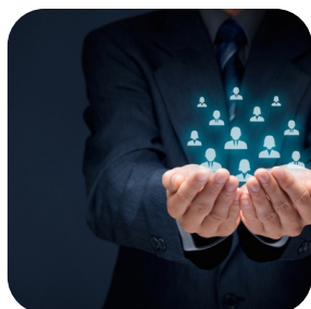
Human Resource Solution

Layanan kami dapat membantu mengoptimalkan waktu dan biaya Anda dengan pengalaman terbaik kami yang sesuai dengan harapan Anda