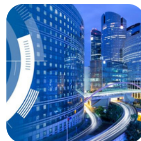
On Demand Service